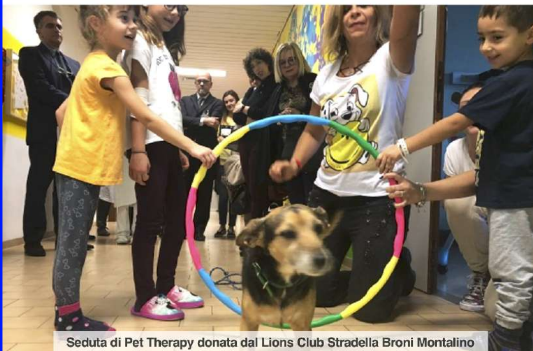
Seduta di Pet Therapy donata dal Lions Club Stradella Broni Montalino

tutta la popolazione è invitata a partecipare